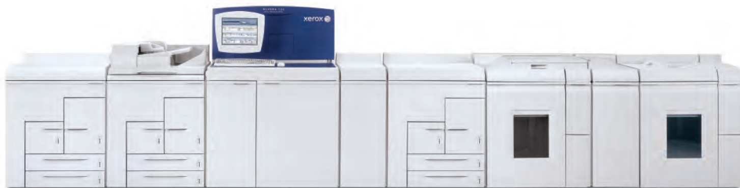
Produkční systém Xerox Nuvera® 100/120/144 EAQ s profesionálním RIP serverem FreeFlow®, integrovaným skenerem, rozšířenou hustotou rastru, dodatečným prokládáním, inline stohováním a šitím