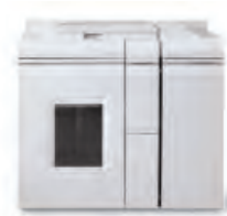
Jednotka základního finišeru - Direct Connect