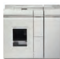
Jednotka základního finišeru Plus