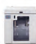
Velkokapacitní zásobník Xerox® DS5000