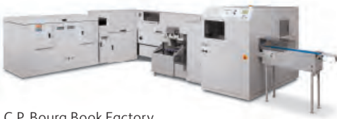
C.P. Bourg Book Factory s ořezem CMT 330 3 Knife Trim