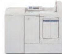
Xerox® DB120-D Document Binder