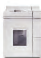
Jednotka základního finišeru