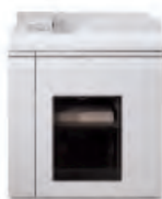
Xerox® DS3500 Stacker