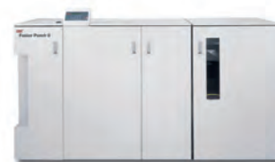
GBC® FusionPunch® II s odsazovacím stohovačem