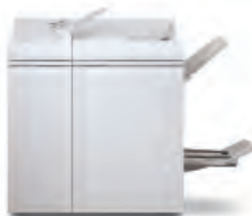
Multifunkční profesionální finišer Plus