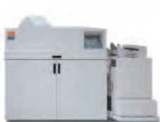
C.P. Bourg BDFx Booklet Maker s Square Edge