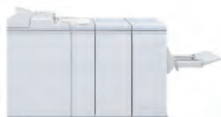
Plockmatic Pro 30 Booklet Maker (k dispozici pouze pro model 100/120/144)