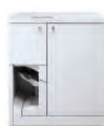
Xerox® Tape Binder